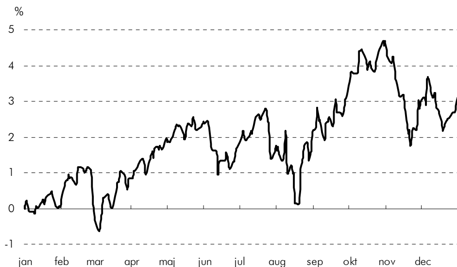
SAMLET AFKAST I 2007 FØR SKAT

Afkastet varierer fra år til år, og det er vigtigt at se det over en længere periode. I de seneste 10 år har DIP haft et gennemsnitligt afkast på 7,5%. Dette afkast er rigtig godt, og der ligger en udfordring i at formidle denne information til flere ingeniører, så de melder sig ind i DIP og får en bedre pensionsordning.