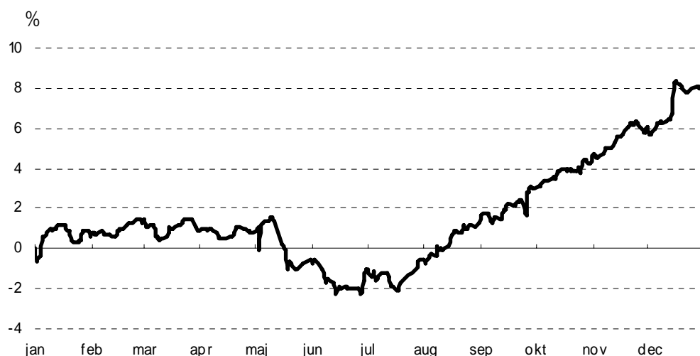
SAMLET AFKAST I 2006 FØR SKAT

Afkastet varierer fra år til år, og det er vigtigt at se det over en længere periode. I de sidste 10 år har DIP haft et gennemsnitligt afkast på 8,8% før skat.